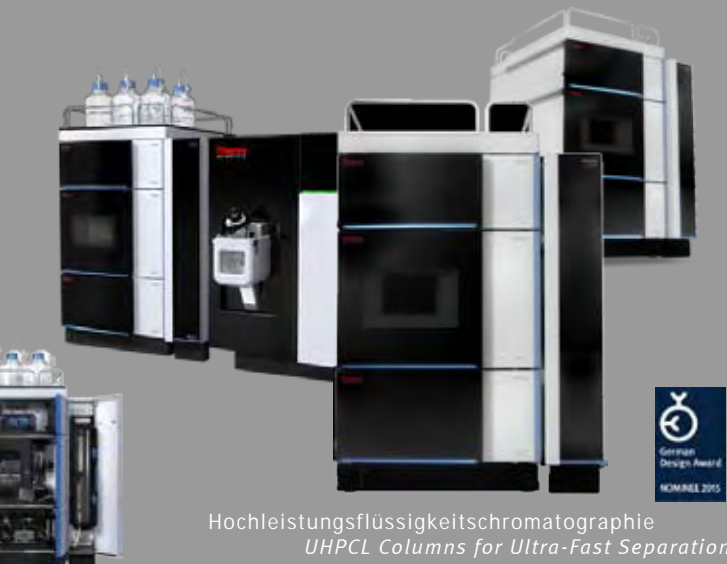
Hochleistungsflüssigkeitschromatographie UHPCL Columns for Ultra-Fast Separation

USP - the link between design and engineering We have a longstanding expertise in crossfunctional projects. Development and management at the interface of conception, design, engineering, marketing and sales.