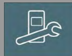
GUI - Wärmendeckensteuerung GUI - Heat Cover Control

We solve problems for different applications, Web based, mobile or embedded. We want our customers are more than just convinced.