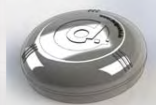
Spare part / Cover made with transparent ABS plastic