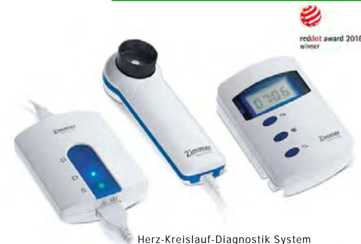
Herz-Kreislauf-Diagnostik System Cardio Vascular Diagnostic System

We have a deep understanding of the ergonomic and hygienic aspects in the medical sector. This way we have been creating user friendly medical goods in all scales for more than 15 years. X-ray units, surgical tables, surgical lights, wearable monitoring, homecare solutions, rescue equipment etc.