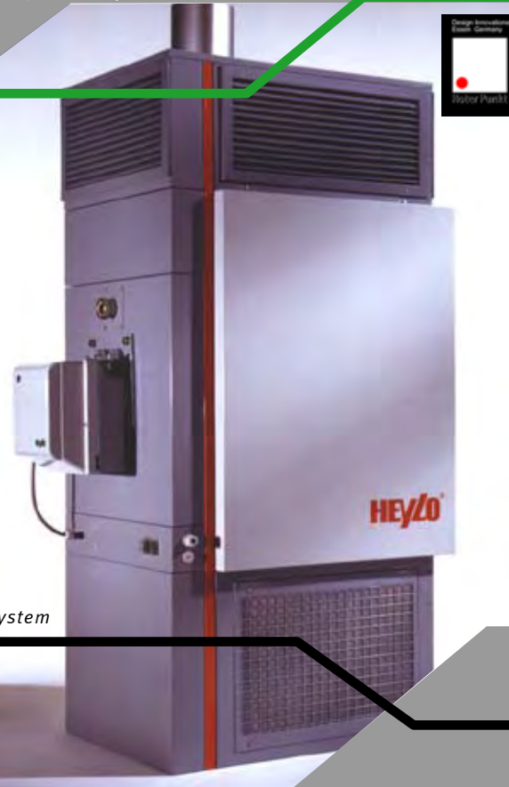
Industrie Umluftheizung Industrial Air Heating System

There is no contradiction in design to cost and a excellent formal expression. They affect and condition each other. We do capital goods since 1997 and can offer you a full service design. From customer journey, conception and design to engineering and series production support.